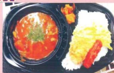
いちばん特製カレー